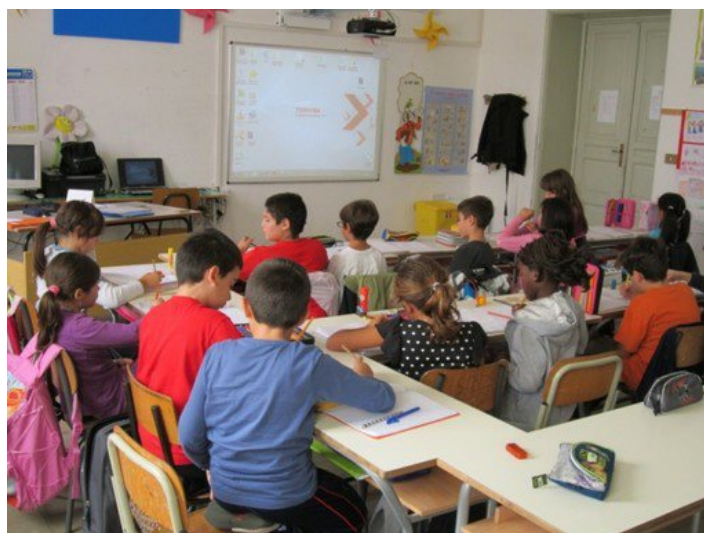
"Provaci ancora, Sam!": un progetto innovativo per contrastare la dispersione scolastica

Coinvolti 10 mila ragazzi e ragazze nei prossimi 3 anni. Il protocollo firmato da Comune, Ufficio Scolastico Regionale per il Piemonte, Compagnia di San Paolo con la Fondazione per la Scuola e la Fondazione Ufficio Pio