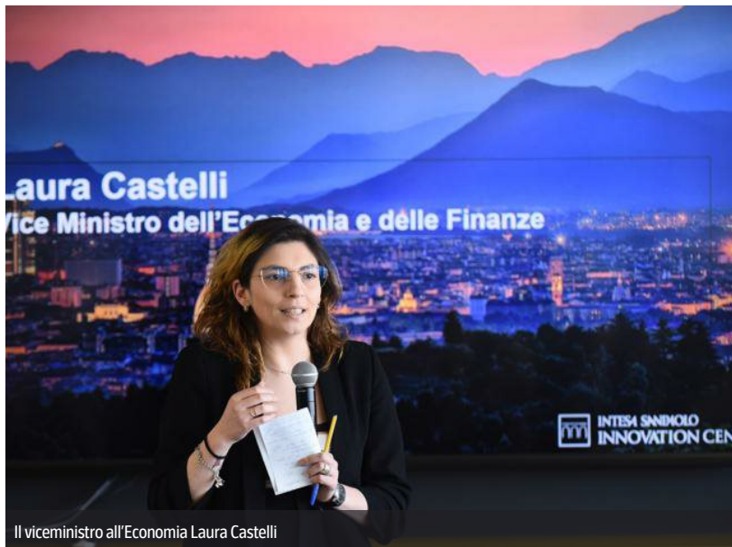
Il viceministro all'Economia Laura Castelli

Confronto con Ericsson, Fastweb, Open Fiber, Tim, Vodafone e Wind Tre sul tema «Città e cittadini del futuro». Il viceministro Castelli: «Uno Stato si deve rendere conto di come può supportare questo tipo di sviluppo che cambia la vita quotidiana della gente»